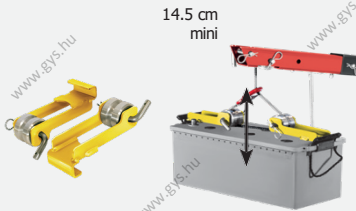
Emelőhorog az akkumulátorhoz