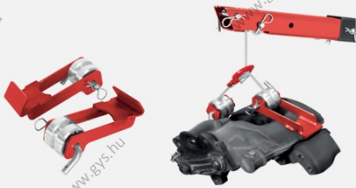
Emelőhorog a féknyereghez