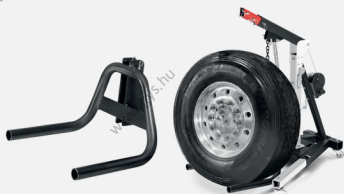
Emelővilla a kerékhez Ø 80-120 cm 200 kg max

Közvetlenül emeli fel az agy- és tárcsaszerelvényeket a kábellel és a kámpóval.